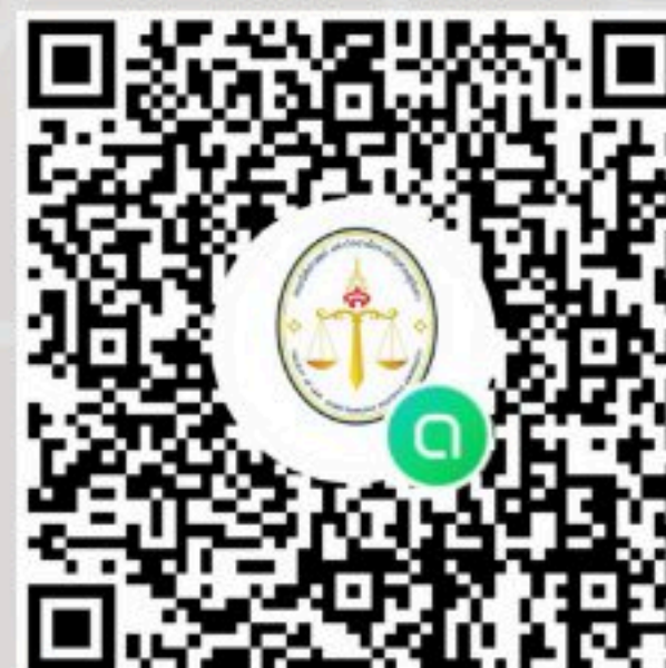
หลักสูตรนิติศาสตรบัณฑิต (ภาคพิเศษ บุคคลทั่วไป)

ผู้สำเร็จการศึกษาจากคณะนิติศาสตร์ สามารถสมัครเข้าเป็นนักศึกษาของสำนักอบรมศึกษากฎหมายแห่งเนติบัณฑิตยสภา และสามารถสมัครเป็นสมาชิกวิสามัญแห่งเนติบัณฑิตยสภา โดยไม่ต้องผ่านการฝึกอบรมวิชาว่าความจากสภากายความ