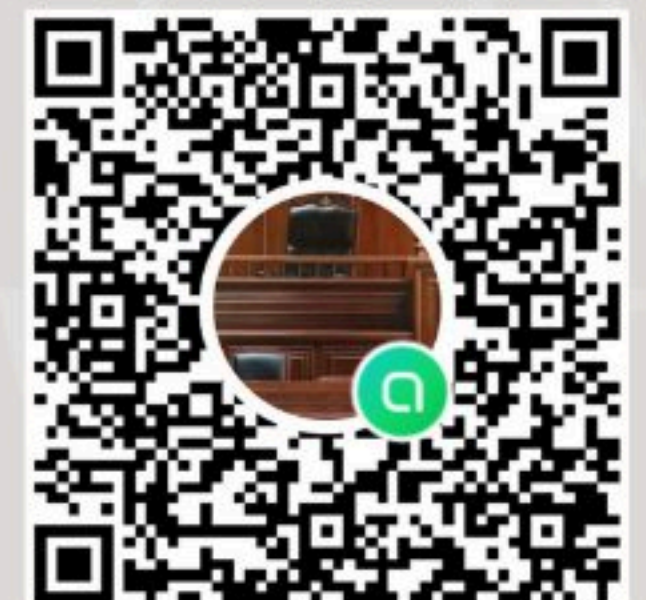
หลักสูตรนิติศาสตรบัณฑิต (ภาคพิเศษ ปริญญาตรีใบที่ 2)