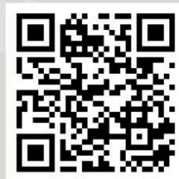
สนใจสมัครเรียน