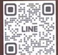
สอบถามรายละเอียด