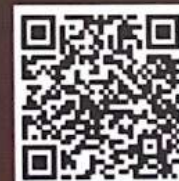
ระบบการรับสมัคร