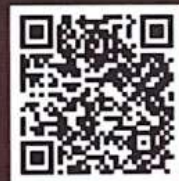
ประกาศรับสมัคร